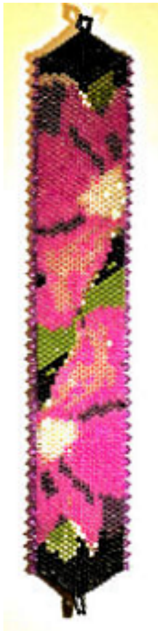
Chart #:9 DB-1458 Silver Lined Honey Opal Count:17

Chart #:6 DB-1003 Metallic Midnight Blue/Gold AB Count:198